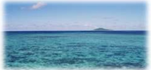
宮古島モズクの養殖地域