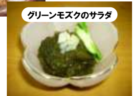
グリーンモズクのサラダ

味が付いていないモズクを望んでいる食事制限中の消費者や、健康に留意する購買層をターゲットに、食材として宮古島モズクの市場開拓を行う。