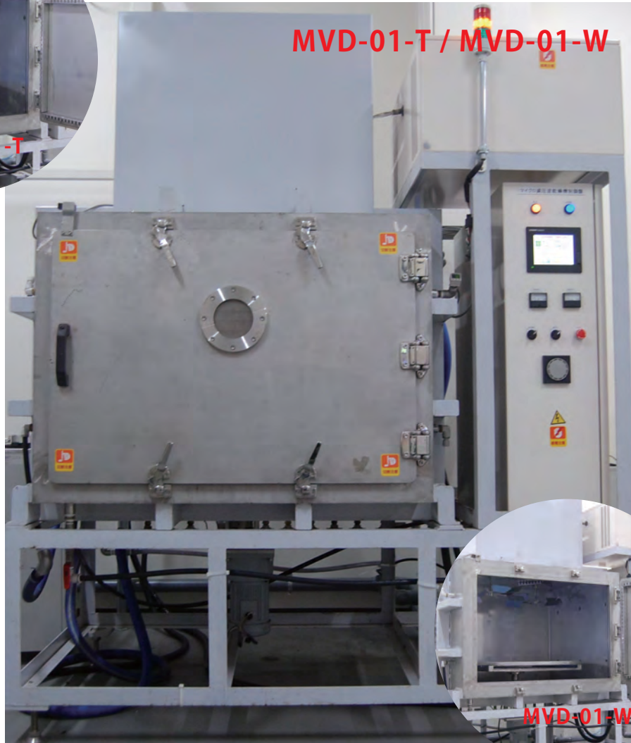
MVD-01-T / MVD-01-W